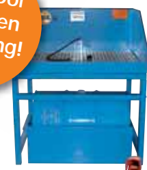
IBS-onderdelenreiniger type M, met een draagvermogen van 500 kg en grote spatplaat.