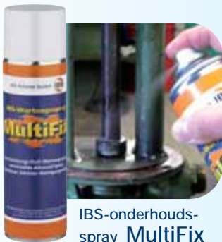
IBS-onderhouds- spray MultiFix

Veelzijdig bruikbaar, zeer werkzaam reinigingsmiddel dat verontreinigingen snel en voorzichtig verwijdt. Artikelnr: 2050020