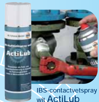
IBS-contactvetspray wit ActiLub

De IBS-kettingspray VivaLub werd speciaal ontwikkeld voor een duurzame binnen- en buitensmering van snel of langzaam lopende aandrijfelementen. Artikelnr: 2050247