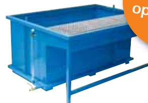
Dompelbad met druiprek.