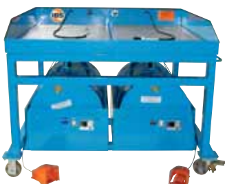
Gemodificeerde IBS-onderdelenreiniger type M, verrijdbaar, met twee bedieningsplaatsen, incl. opvangbak, draagvermogen 1000 kg.