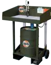
IBS-onderdelenreiniger type F2 met individueel lakwerk.